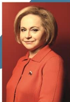
Любовь Николаевна Духанина, заместитель председателя Комитета по образованию и науке ГД РФ, член Центрального штаба ОНФ, координатор проекта «Равные возможности – детям»

ВЫ ХОТИТЕ, ЧТОБЫ ВАШ РЕБЕНОК РАЗВИВАЛСЯ, ЗАНИМАЛСЯ ТЕМ, ЧТО ЕМУ НРАВИТСЯ, И ПОСЕЩАЛ ДЕЙСТВИТЕЛЬНО ИНТЕРЕСНЫЕ И НУЖНЫЕ КРУЖКИ?